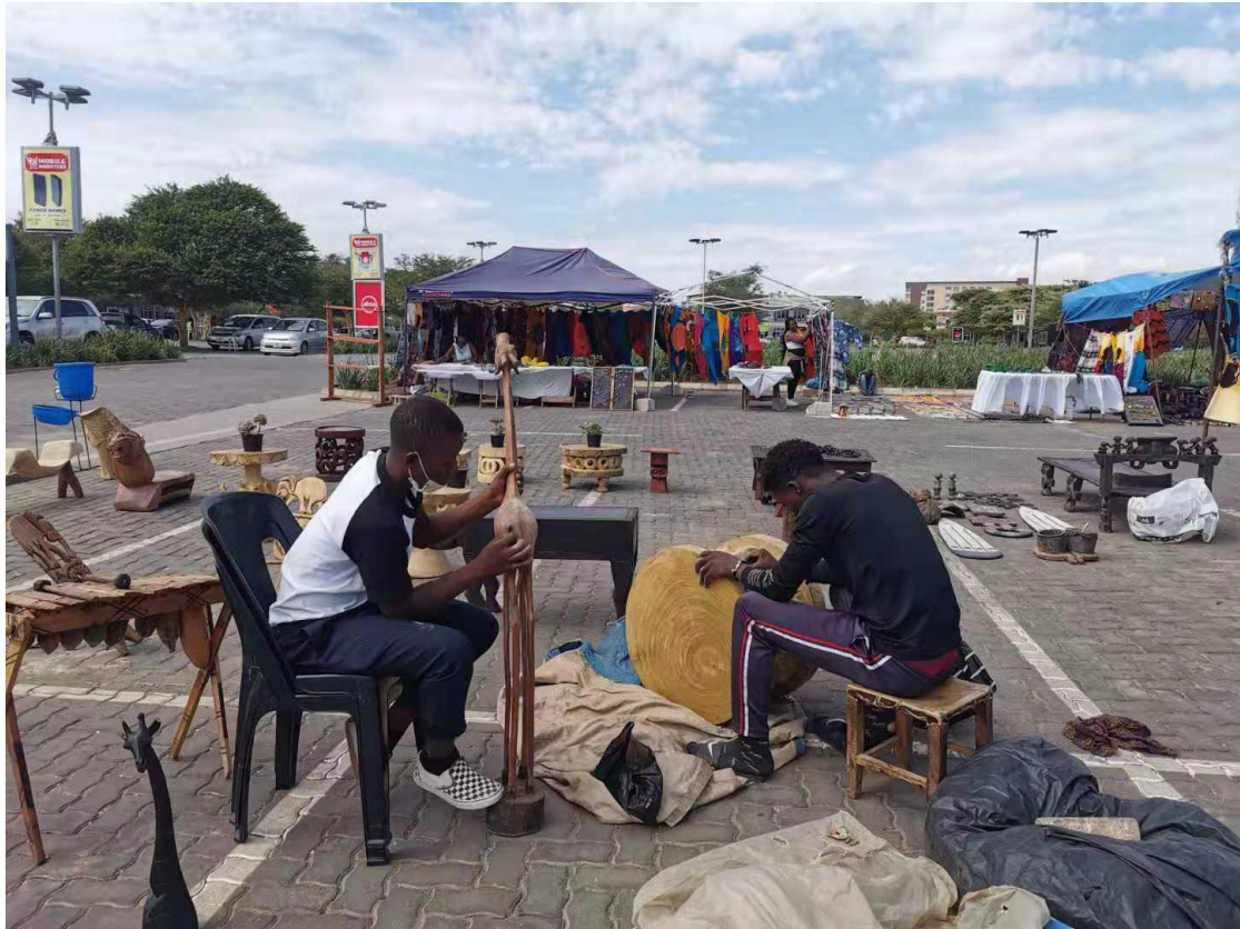
当地的市场，纯手工制作