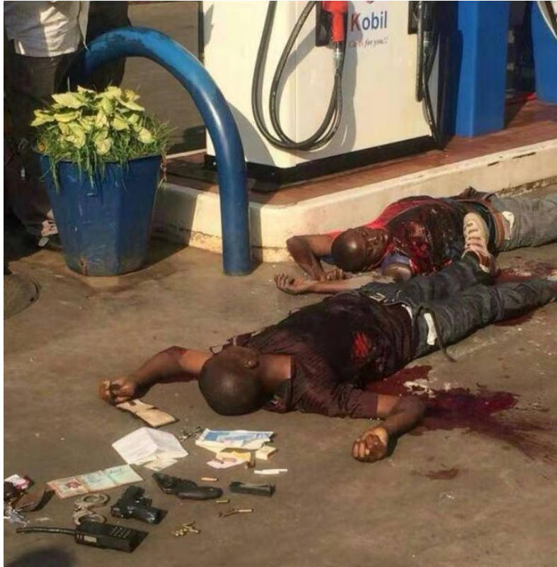
首都卢萨卡抢劫案