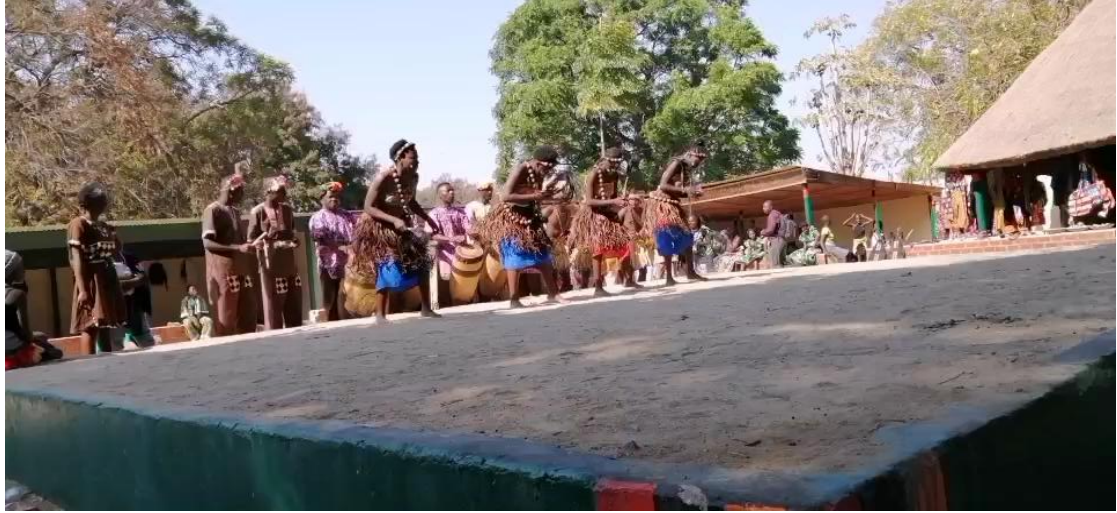
当地的舞蹈表演，需要付费