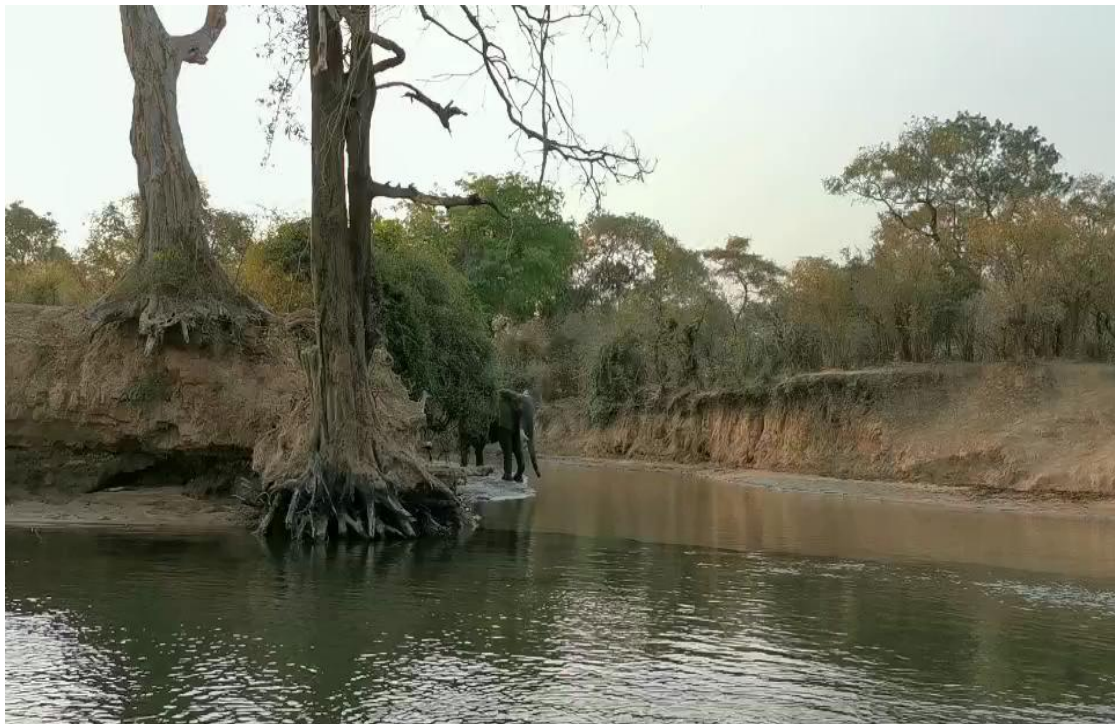
自然环境，河水里有鳄鱼和河马，不敢随便下水