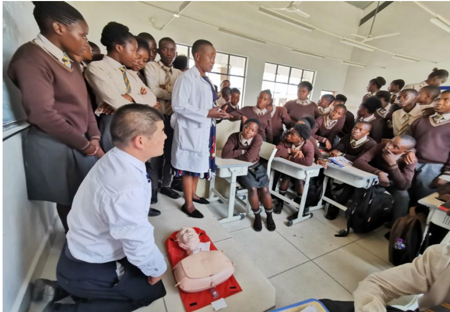
到卡翁达广场小学健康讲座